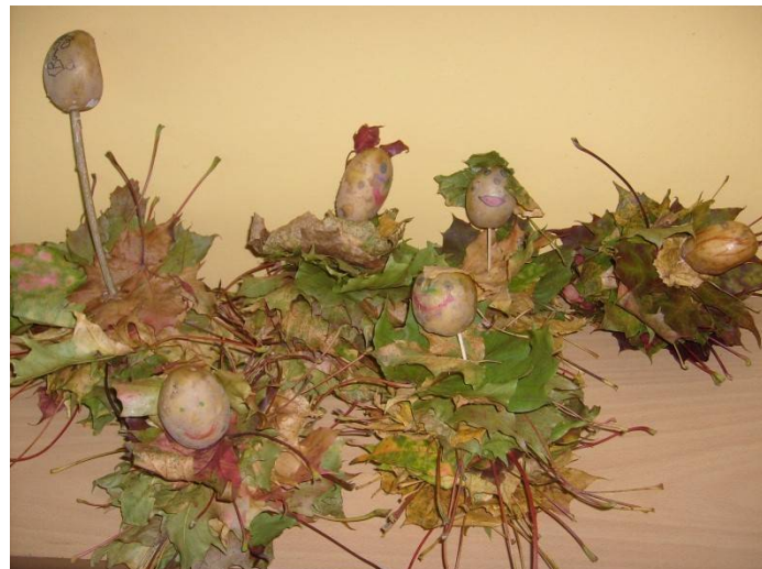
Škola – bramborové postavičky