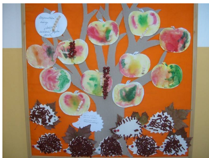
Školní družina – paleta podzimu