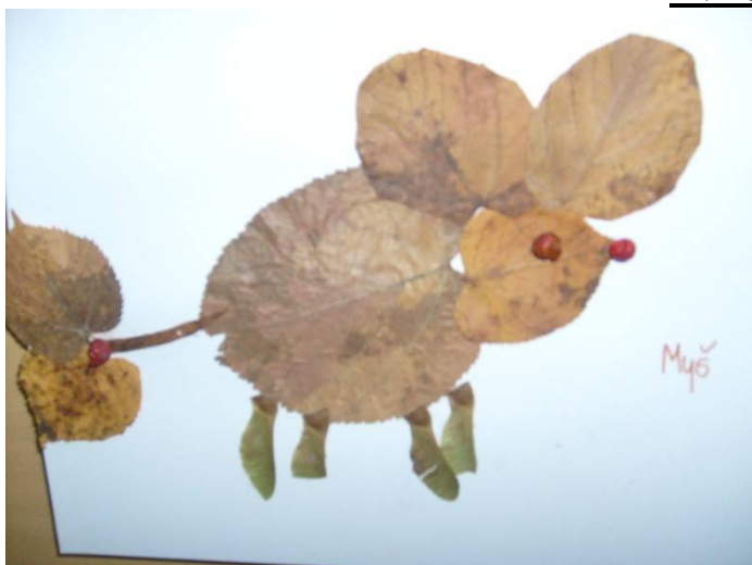
Myš – Adélka