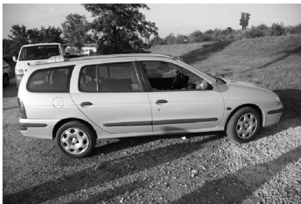
Boční pohled na poškozené vozidlo

2) Pachatel rozbil okno pravých předních dveří vozidla zn. Renault Megane, které bylo zaparkováno na volně přístupném parkovišti u silnice vedoucí do kempu v obci Vikletice, následně z auta odcizil kabelku, ve které byla peněženka s osobními doklady, platebními kartami a dalšími doklady s finanční hotovostí, čímž poškozeným způsobil škodu za téměř 7 tis. Kč. (tr. čin)