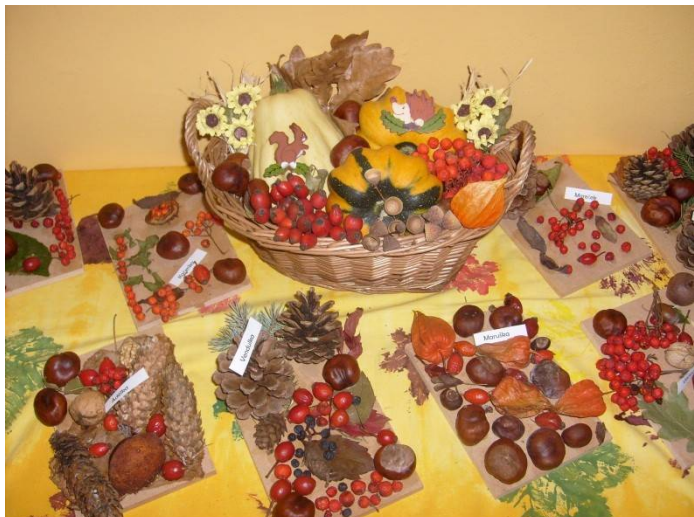
Školka – nástěnka podzimu